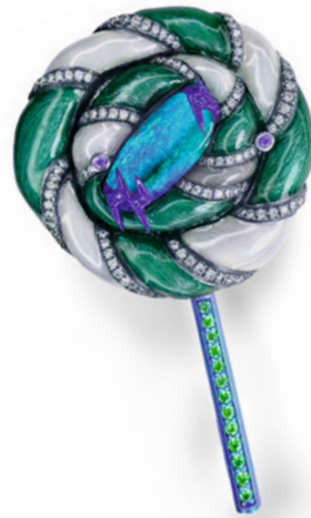
A.WIN SIU 肖信同 Something Sweet 系列欧泊棒棒糖胸针， 欧泊、铝、钻石、沙弗莱、坦桑石。