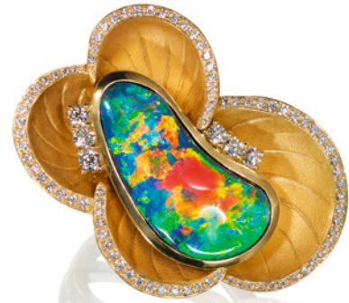
从上至下，从左至右 KREIS JEWELLERY 戒指， 镶嵌一颗 8.8 克拉澳大利亚黑蛋白石。

如今，审美变得更加多元化，越来越多设计师爱上蛋白石，并以它为载体，为珠宝设计注入新活力。在此次展览中，蛋白石作为主角，与多种彩色宝石组合搭配，将材质之间的融合推向了新高度，形成一系列令人眼前一亮的杰作。此外，展览中还通过视频与摄影呈现出蛋白石局部与动态的美丽，这种数字化的艺术方式也为宝石爱好者们提供了另一个欣赏蛋白石的视角，启发着人们对蛋白石在艺术价值上更深层的探索。