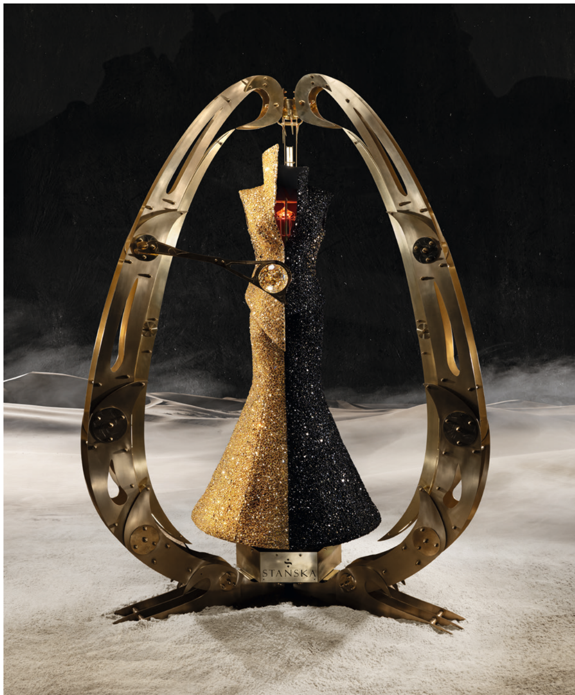
奇幻作品“Equilibrium of Powers”《力量的平衡》。

设计、文化、艺术、教育在此交融，荟萃珠宝的多面璀璨，GemGenève 为世人展现了创意的力量，成为珠宝人们享乐交流的“桃花源”。数据显示，此届 GemGenève 共迎来 3566 名观众，比 2023 年 11 月的上一届增加了 10%。随着人们的时尚观念与品位在不断升级革新，下一次，这场珠宝盛会又会带来哪些惊喜？满怀期待，静候相遇。可以提前做个预告，有兴趣前往参与展览的人士可以向我们查询及登记领取免费门票（数量有限）。